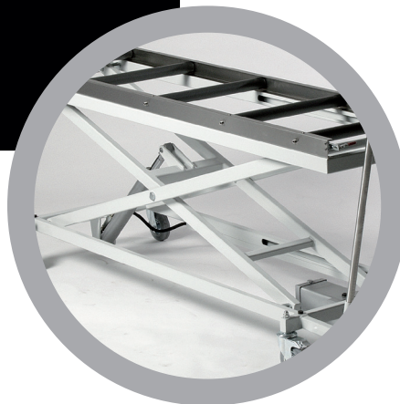
Carrello idraulico Hydraulic trolley