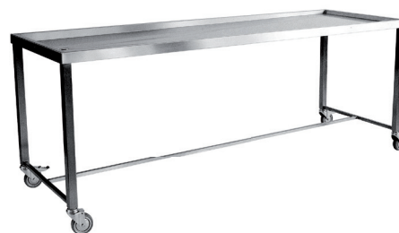
Tavolo Table C