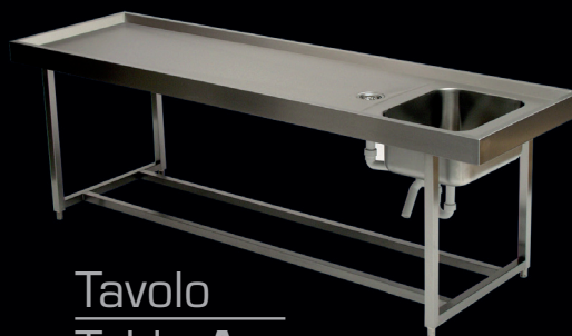
Tavolo Table A

Beside the mortuary refrigerators and chambers ranges, Fiocchetti offers solutions for corpses transport and treatment. Three autopsy tables are offered, all made of stainless steel: a basic table equipped with castors – instrument table, neck and body supports on request, to more complete units equipped with basin, shower and sockets and the chance to add specific accessories like the grinder and the hydroaspirator.