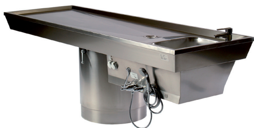
Tavolo Table B