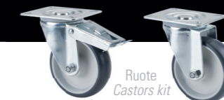
Ruote Castors kit