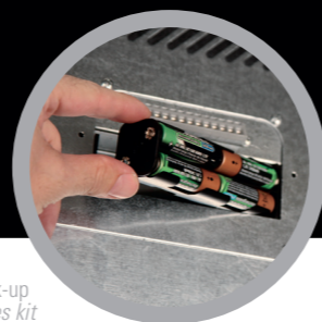
Kit Batterie back-up Back-up batteries kit