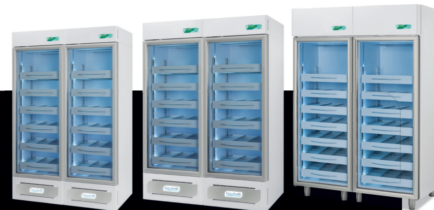
Medika 800 2T

1500 lt (700+700) L 1500 (750+750) P 840 H 2100