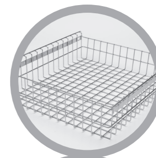
Cestello in acciaio inox Stainless steel basket