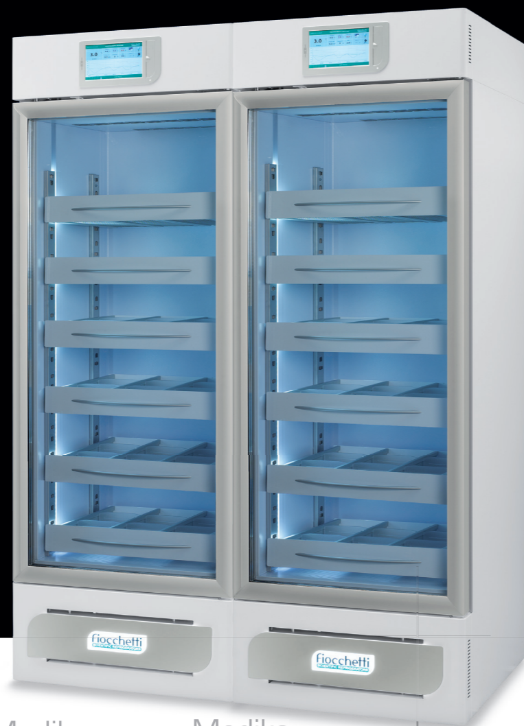
Medika 1000 2T

800 lt (400+400) L 1200 (600+600) P 655 H 1955