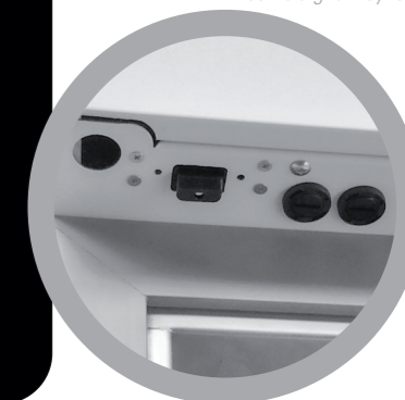
Serratura elettronica Electric digital key lock