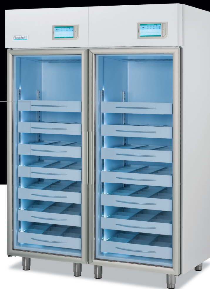
Medika 1500 2T

1000 lt (500+500) L 1440 (720+720) P 765 H 2080